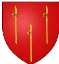
Cambrai : variantes des armes selon les définitions : aux loups, aux lions, fascés, angons ou crocs...