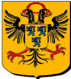
Cambrai, ville d'Empire