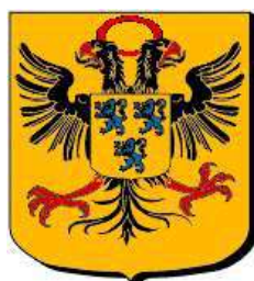
Cambrai, ville d'Empire