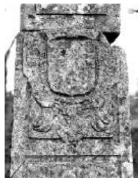
Les armes des Bullion sur la Croix dite «de L'Aunay» à Crespières (78)