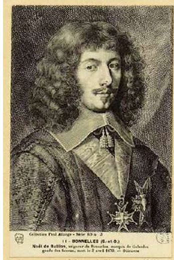
Noël de Bullion

Claude III de Bullion et Angélique Faure