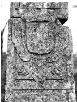
Les armes des Bullion sur la Croix dite «de L'Aunay» à Crespières (78)