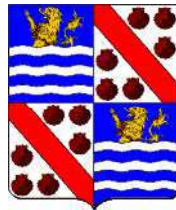
Claude de Bullion & branche Bullion-Fervacques