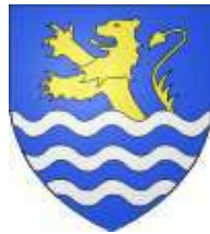
Les armes des Bullion telles que les ont conservées les communes de Bullion, Crespières et Davron.