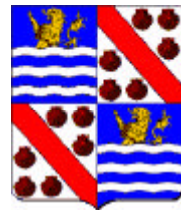
Claude de Bullion & branche Bullion-Fervacques