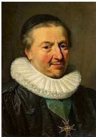
Claude III de Bullion

Branche des marquis de Courcy et seigneurs de Fontenay qui suit (p.9)