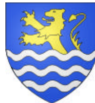
Les armes des Bullion telles que les ont conservées les communes de Bullion, Crespières et Davron.