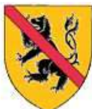
Thomas de Bruyères cadet (brisure : une bande de gueules)