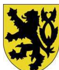
Bruyères, seigneurs de Puivert