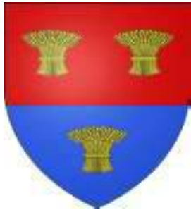
William de Braose, 4° Lord Bramber