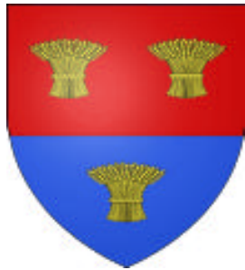
William de Braose, 4° Lord Bramber