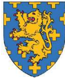
William de Braose