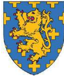
William de Braose