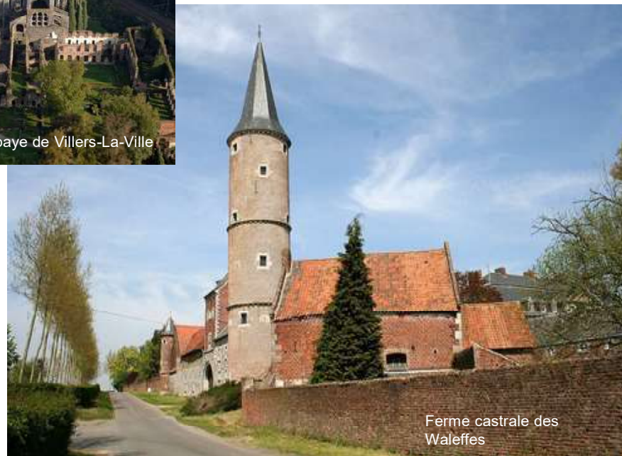
Ferme castrale des Waleffes