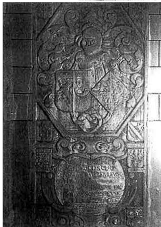
Pierre tombale de Brabant