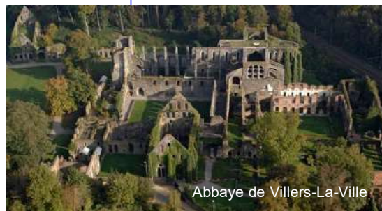
Abbaye de Villers-La-Ville