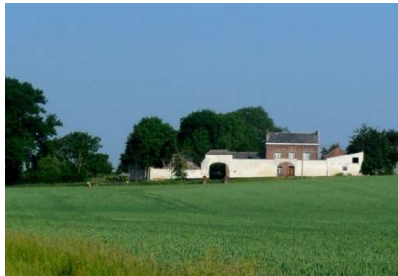
Ferme du Moulin-Brabant