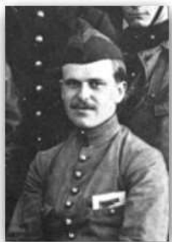
Marcel-Jules Antoine de Brabant