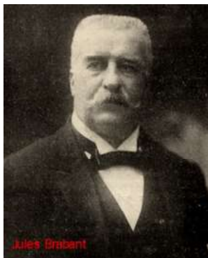
Jules-Melchior de Brabant