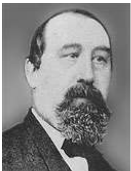
Charles-Joseph de Brabant