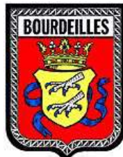
Bourdeilles commune (24)