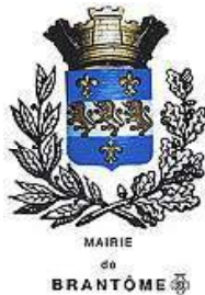
Brantôme commune (24)