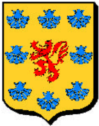
Bourbon ancien : 1 ère maison de Bourbon-Souigny & Dampierre