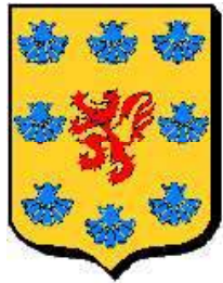
Bourbon ancien : 1 ère maison de Bourbon-Souigny & Dampierre