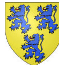
Vicomtes de Limoges

Guillaume II «Taillefer» d'Angoulême comte d'Angoulême, seigneur de Blaye (~1000, par don de Guillaume «Le Grand», duc d'Aquitaine) ép. YYYY (fille de ZZZ)