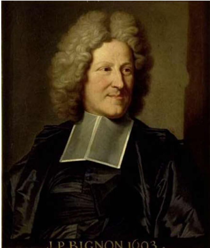
Jean-Paul Bignon portrait par Hyacinthe Rigaud (1685)