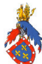
Alençon (grandes armes)