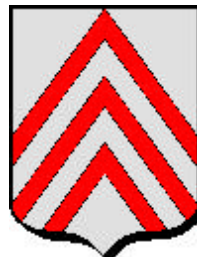
Alençon (armes du Perche)