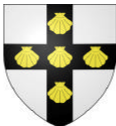
Châtellains de Beauvais