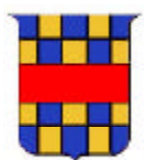
Jeanne de Beaugency ~1300