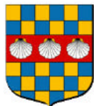
Simon de Beaugency (1238)