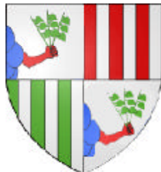
Babou de La Bourdaisière (le parti palé n'y est pas respecté)