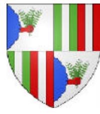
Montlouis s/Loire conserve les armes des Babou