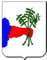
Babou de La Bourdaisière (armes d'origine ?)

"Généalogies des maîtres des Requêtes ordinaires de l'Hôtel du Roi", François Blanchard, 1652