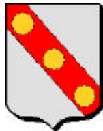
comté d'Aumale (variante)

Alba Marla (marnes blanches), Aubemalle, Aumalle puis Aumale comté cédé ~998 par Arnoul, comte de Flandres à Richard 1 er , duc de Normandie. 1 er château édifié dès 996. Aumale reste aux Normands jusqu'à sa conquête (et destruction) par Philippe II «Auguste».