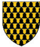
Aumale Albermale (Angleterre)