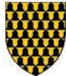
Aumale Albermale (Angleterre)