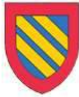
comté d'Aumale brisure des armes de Ponthieu)