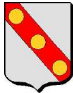
comté d'Aumale (variante)

Alba Marla (marne blanche), Aubemalle, Aumalle puis Aumale comté cédé ~998 par Arnoul, comte de Flandres à Richard 1 er , duc de Normandie. 1 er château édifié dès 996. Aumale reste aux Normands jusqu'à sa conquête (et destruction) par Philippe II «Auguste».