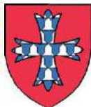
Aumale (Angleterre) : William de Forz