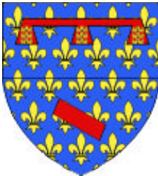
Aubigny-en-Artois (cité, 62)