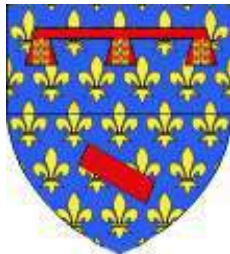
Aubigny-en-Artois (cité, 62)