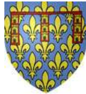
Robert 1 er

Comtes d'Artois puis seigneurs de Conches (Capétiens)