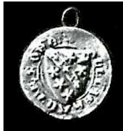
Jean Arrode sceau (12/06/1299) in Drouet d'Arcq (4097)