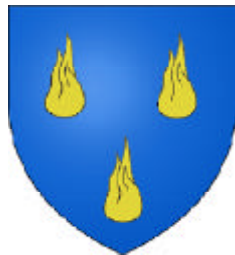
Arouet & Voltaire