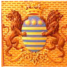
le blason d'Aligre au château des Vaux