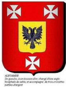
ALEGAMBE De gueules, à un écusson d'or, chargé d'une aigle bicipite de sable, et accompagné de trois croix en sautoir parties d'argent