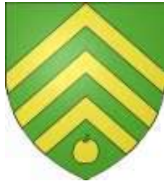
Aigremont (commune, 78)