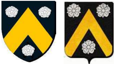
Abos (Follainville, Herville)